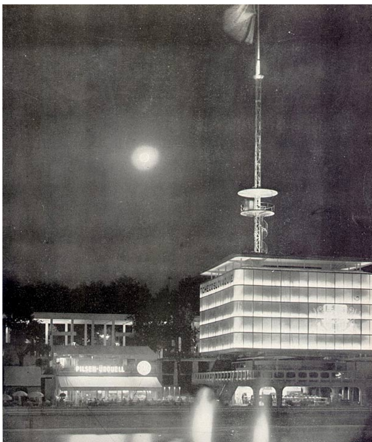
Plzeňský Prazdroj nechyběl ani na EXPO 2015 v Miláně, ale například ani na EXPO 1937 v Paříži.