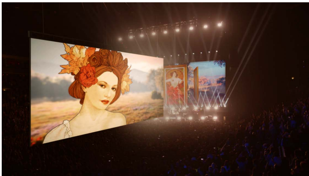
Mezinárodní projekt iMUCHA oživuje odkaz Alfonse Muchy s pomocí nové 3D technologie.