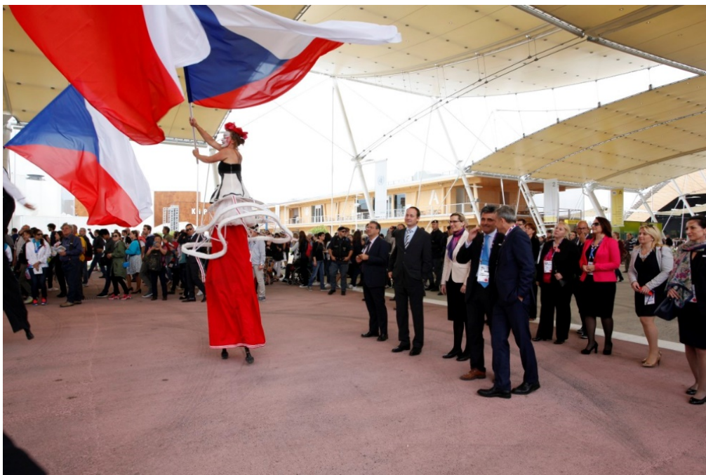
Na národním dni na EXPO 2015 v italském Miláně se podílelo na 150 účinkujících.

Na národním dni na EXPO 2015 v italském Miláně se podílelo na 150 účinkujících a na výstavišti se střídala vystoupení hudebníků, tanečníků, pouličního divadla a dalších umělců. Rozpočet na Národní den v Dubaji je více než dvojnásobný – partnery českého pavilonu bude stát deset milionů korun.