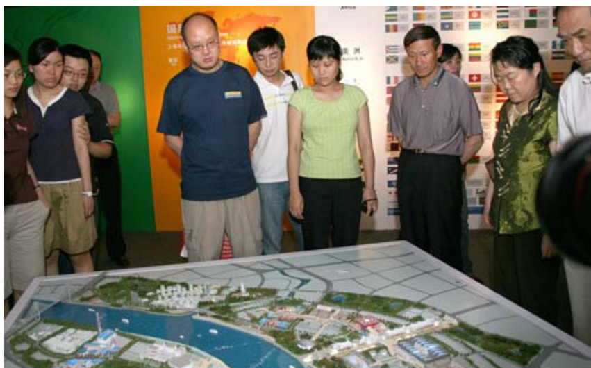
Návštěvníci mají možnost prohlédnout si maketu areálu SV EXPO 2010.

Ústředními tématy, která centrum prezentují, jsou různé aspekty šanghajské výstavy EXPO, Čínská účast na předchozích ročnících a také 150letá historie pořádání světových výstav po celém světě. Všechny tyto oblasti jsou prezentovány prostřednictvím multimediálních videí a také pomocí elektronických knih. Dále je možné prohlédnout si v centru plastické mapy a plány celého areálu a také výstavních pavilonů jednotlivých států. Obsah expozice je aktualizován v závislosti na aktuálních informacích.