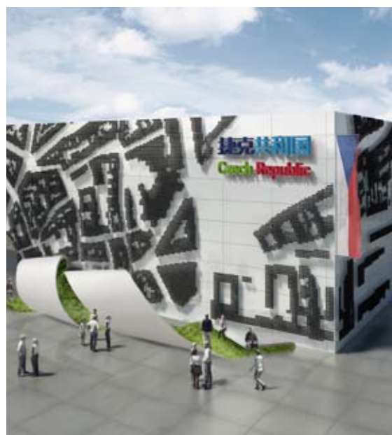
Exteriér českého pavilonu ve dne. Fasáda je tvořena českými puky.