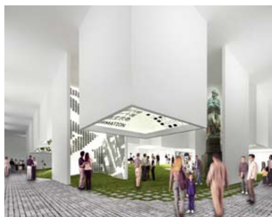
Interiér českého pavilonu – fiktivní město plné technologických zážitků, designových překvapení i nejrůznějších požitků.

ostatních vystavovatelských zemí, k čemuž bude i individuálně upravován v závislosti na konkrétních jednáních. Stane se tak místem, kde můžeme volně prezentovat i podnikatelské subjekty a hospodářské a obchodní úspěchy ČR, které nelze s ohledem na směrnice Světových výstav otevřeně propagovat v samotném prostoru expozice ČR.