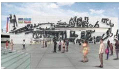
Exteriér pavilonu ve dne