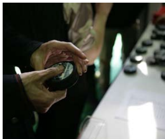
Hokejové puky s nálepkou českého pavilonu.