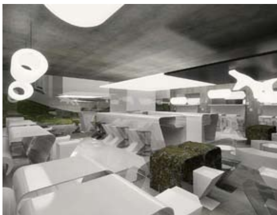
Předpokládaná podoba prostoru restaurace v českém pavilonu

pět. Dalším vyhlášeným výběrovým řízením ze dne 20. července je výběr dramaturga/režiséra na Český národní den. Termín pro odevzdání nabídek byl 14. srpna. V červenci bylo vyhlášeno také výběrové řízení na kurátora na Týden českého designu – vítěz bude opět zveřejněn poté, co budou všichni účastníci vyzooměni o výsledku. U konce je výběrové řízení na podnájem prostor restaurace v českém pavilonu, jehož účelem bylo nalézt provozovatele restaurace s prvotřídním charakterem, která by měla nabízet převážně jídla české kuchyně. Vítězem se stal jediný zájemce a to firma International Gurman Club, která provozovala českou restauraci již na předchozí výstavě EXPO 2005 v japonském městě Aichi.