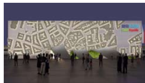
Exteriér pavilonu v noci