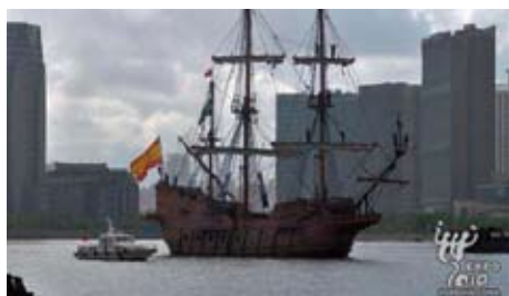
Španělská historická loď v šanghajských vodách

Replika španělské galéry dlouhá 52 metrů a široká 10 metrů zakotvila na konci července ve vodách u výstaviště EXPO 2010. Tím loď s názvem Andalusia završila Týden Andalusie pořádaný ve španělském pavilonu. Kromě toho, že posílá návštěvníkům pozdravy ze Španělska, je považována také za ambasadora přátelství s Andalusií, autonomní španělskou komunitou. Loď opustí Šanghaj v září.