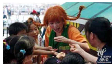
Pipi Dlouhá punčocha ve švédském pavilonu

Ve švédském pavilonu na EXPO 2010 se 4. srpna sešli čínští a švédští autoři dětské literatury a hovořili zde o tvorbě Astrid Lindgrenové, autorky knihy „Pipi Dlouhá punčocha“, a o současné dětské literatuře ve Švédsku a Číně. Pavilon hostil také oslavu dne Pipi, která se skládala ze semináře nazvaného „Po stopách Astrid Lindgrenové: Současná dětská literatura ve Švédsku a Číně“ a z rodinného muzikálu „Pipi Dlouhá punčocha“. Příběhy Pipi byly publikovány již ve více než 60 světových jazycích.