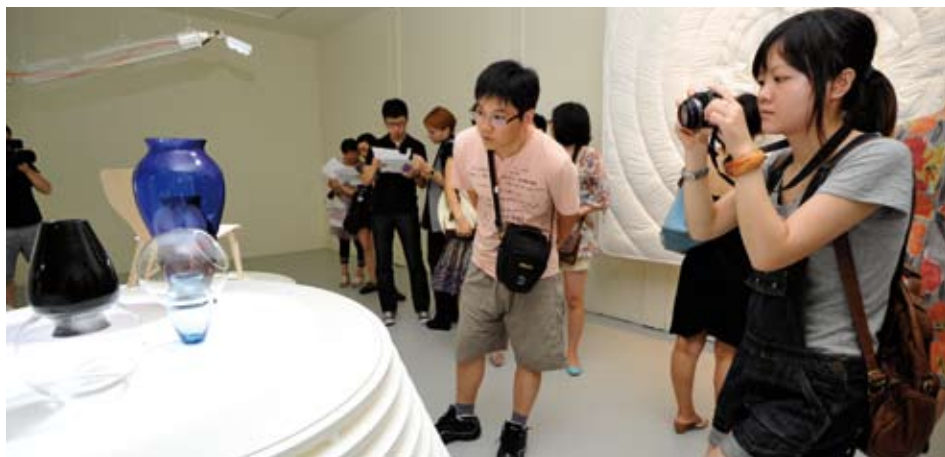
Návštěvníci obdivují jeden z objektů