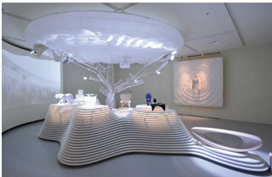
Týdny českého designu – Archiv zázraků