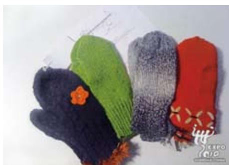
Pletené rukavice ze Švédska

Švédové všech věkových kategorií prokázali svou podporu národnímu pavilonu. Jako odpověď na výzvu personálu švédského pavilonu začali posílat vlastnoručně pletené rukavice různých barev. Stovky palčáků budou mávat všem návštěvníkům pavilonu, když jej budou opouštět. Mnoho pletářů připojilo k rukavicím také pár řádků.