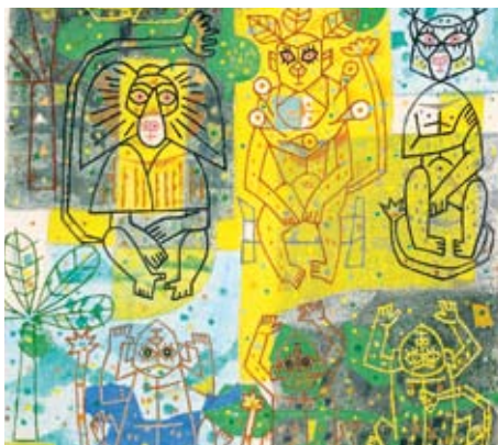
Výstava Opičí král

Vrcholem Českého národního dne bude vystoupení baletu Národního divadla, který kromě kratších moderních choreografií uvede i světovou premiéru nové choreografie vytvořené speciálně pro českou účast na EXPO 2010 uměleckým šéfem baletu Národního divadla Petrem Zuskou.