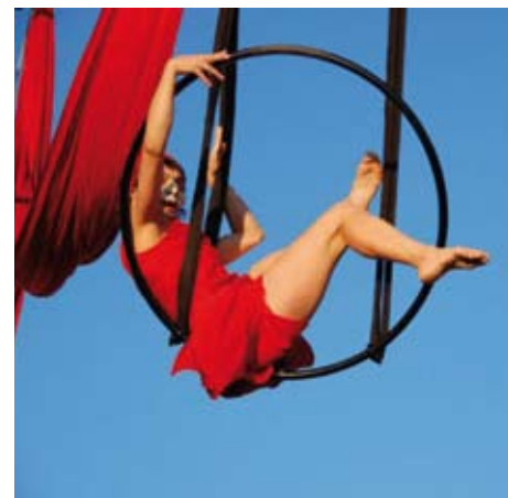
Pouliční divadlo V.O.S.A.

Nejen v rámci Českého národního dne se představí pouliční divadlo, jehož hlavními prostředky budou loutky v životní i nadživotní velikosti, pohyblivé loutkostroje a jednoduché divadelní performance, které budou společně tvořit pouliční průvod postavený na hudbě, emocích a artistických dovednostech. Kromě účasti v mezinárodním průvodu budou členové souboru oživovat i prostor kolem českého pavilonu. Umělecký soubor V.O.S.A. bude na výstavišti přítomen v květnu, srpnu a říjnu.